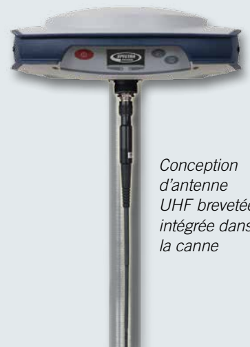
Conception d'antenne UHF brevetée intégrée dans la canne